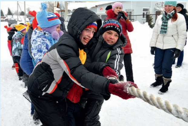
Команда Черепановского района