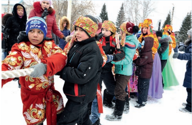
Команда Маслянинского района