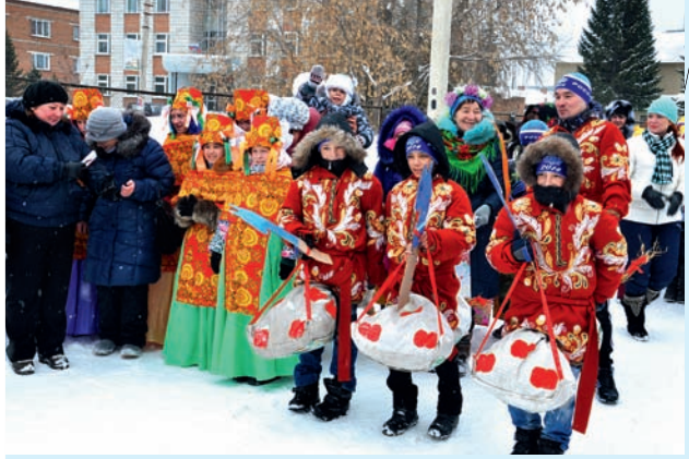
Композиция семьи Угай «Кони в яблоках»