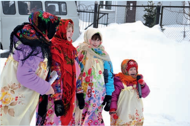
Семья Перепелицыных очаровала всех зрителей