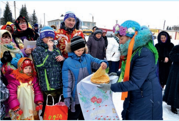
Что же за Масленица без блинов?