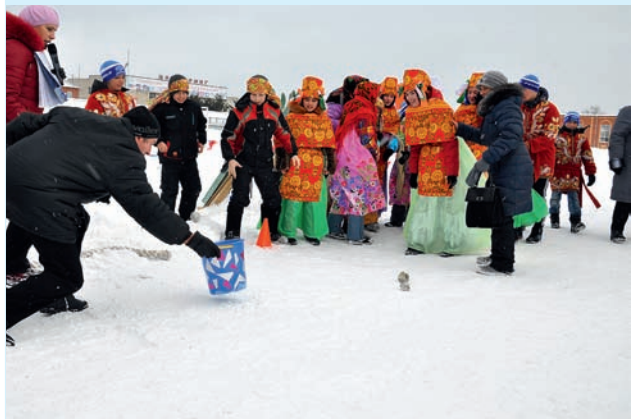
Папы виртуозно ловили ведрами «снаряды» ●