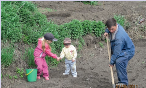
Папа устал. Давай ему поможем