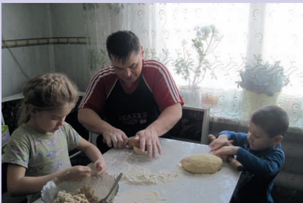
Ох и вкусные будут манты!