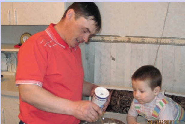
«Надеюсь, папа спросил у мамы, как правильно тесто на блинчики заводить»