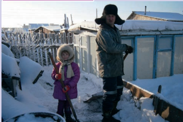
«Вот сделаем горку и будем кататься»