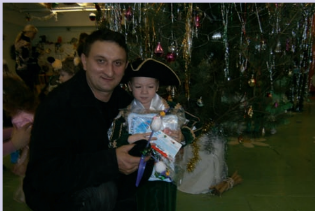
Новый год – любимый праздник