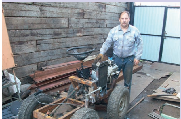
В умелых руках любая железяка становится транспортом