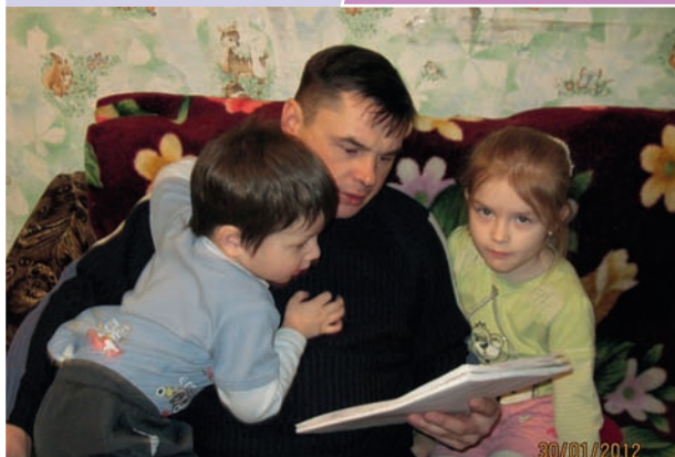
Сказка перед сном