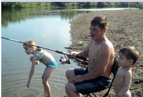
Ловись, рыбка, большая и маленькая