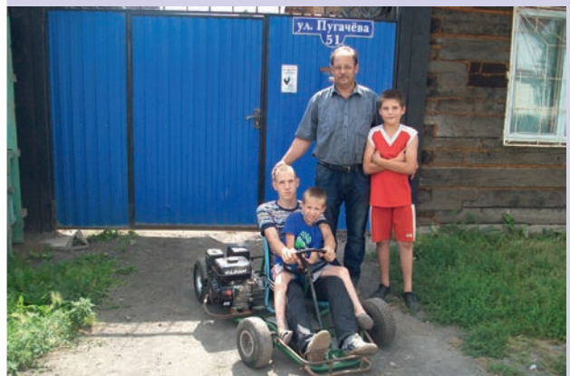
Такого транспорта нет больше ни у кого. Потому что ручная работа. Эксклюзив