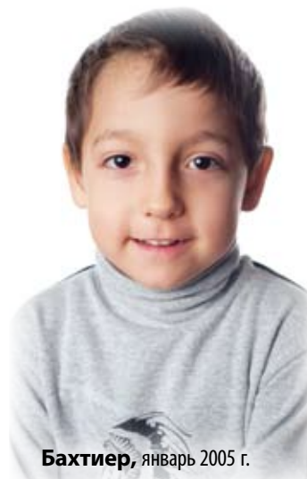
Бактиер , январь 2005 г.