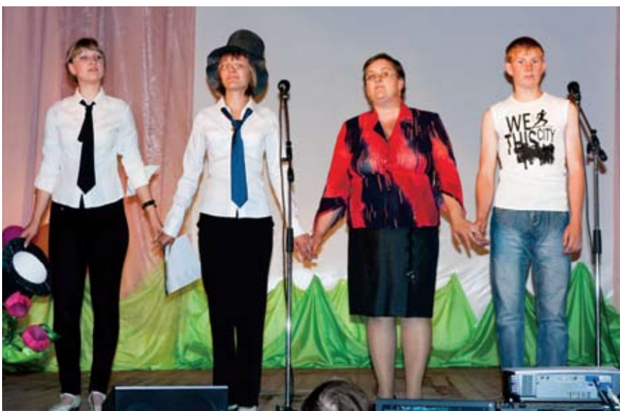
Участники зонального этапа конкурса в Кыштовском районе