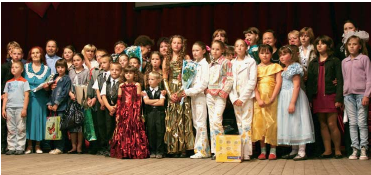
Участники зонального этапа в Тогучинском районе

Яркий, полный приятных сюрпризов, фестиваль состоялся, по традиции в ДОЛ «Дзержинец» 24 – 25 августа.