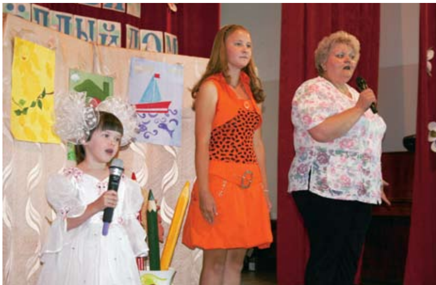
Участники зонального этапа конкурса в г. Бердске