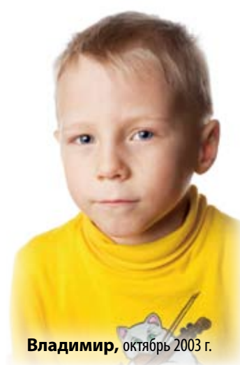
Владимир , октябрь 2003 г.