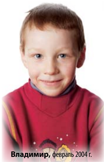
Владимир , февраль 2004 г.