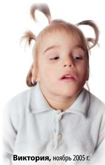
Виктория , ноябрь 2005 г.