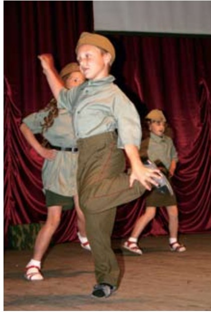
Выступление семей Одарич и Бирюлиных (Тогучинский район). Победители в номинации «Театр семейных миниатюр»