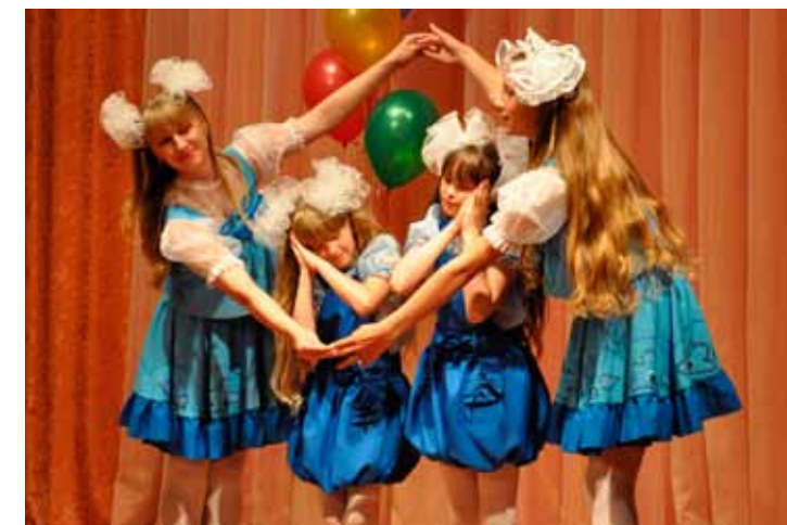
«Мы в домике», Баган