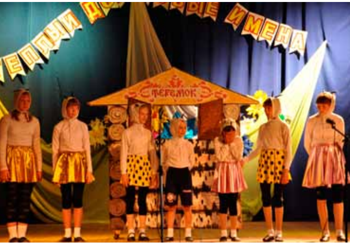
Сказка «Теремок», Венгерovo