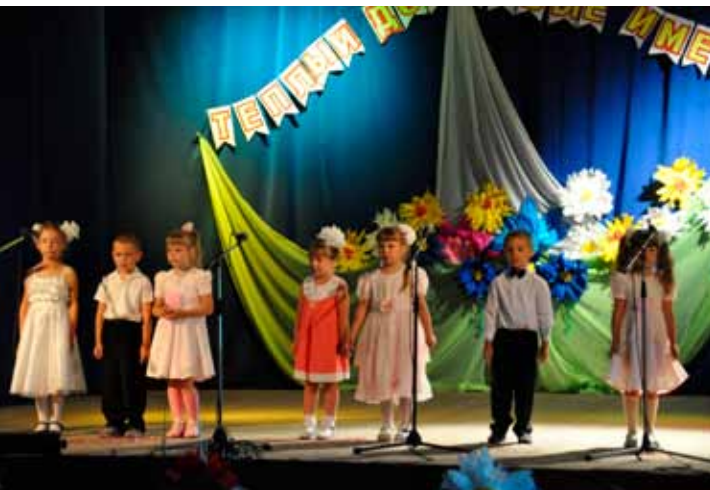
Детский ансамбль, Венгерovo