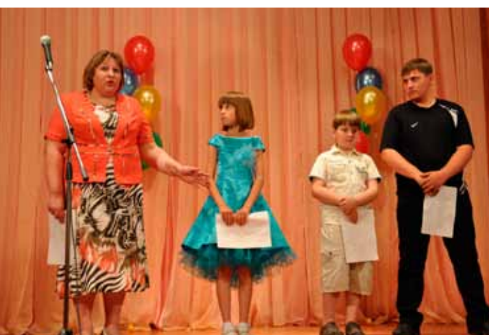
Представление семьи, Баган