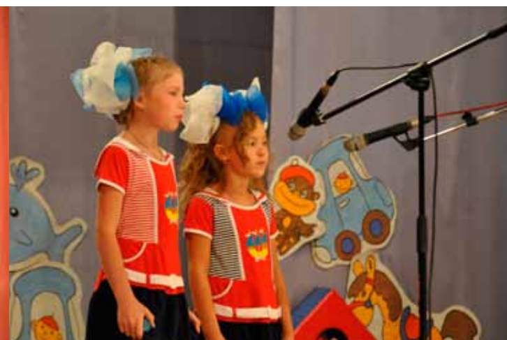
Вокальный дуэт, Болотное