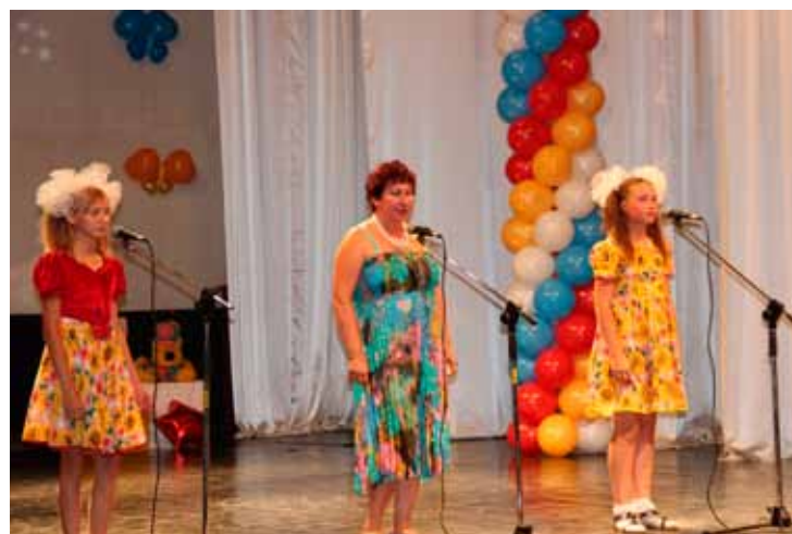
«На сцене вместе с мамой», Коченево