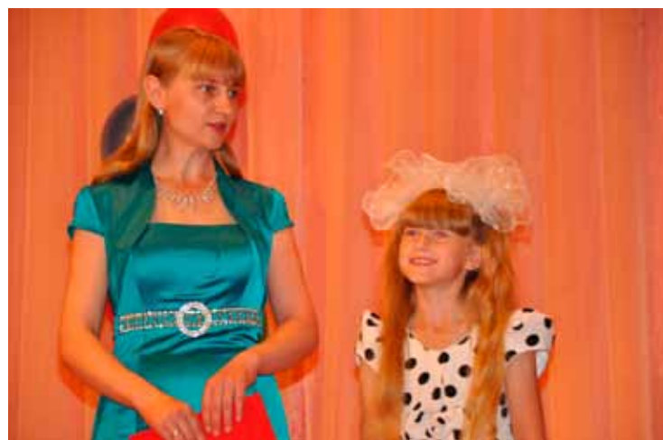
«Рассказываем о себе», Баган