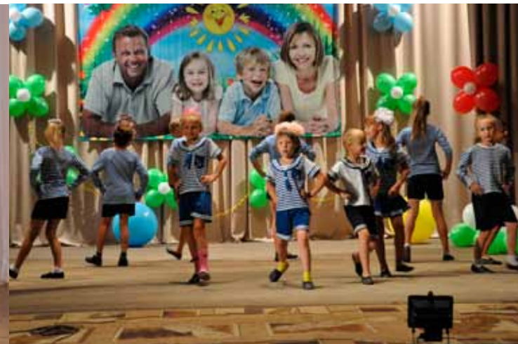
Команда морячков, Черепановo