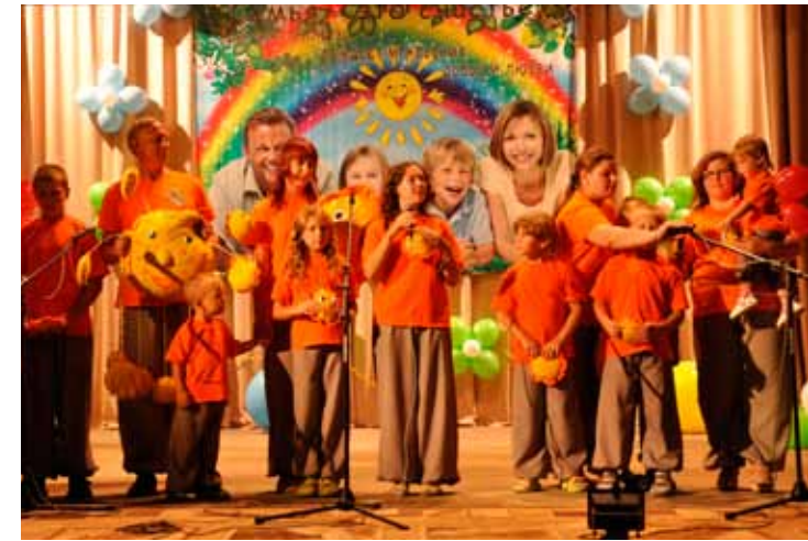
Оранжево настроение, Черепановo