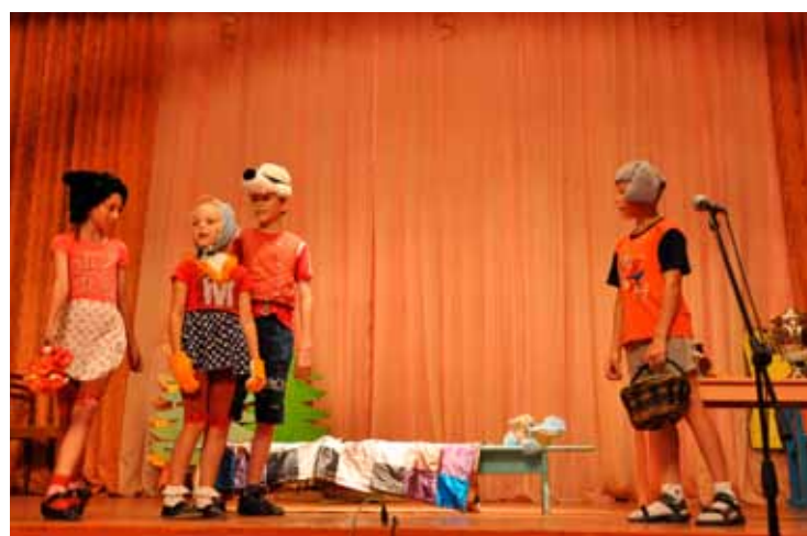
Спектакль «красная шапочка» в современной постановке, Баган