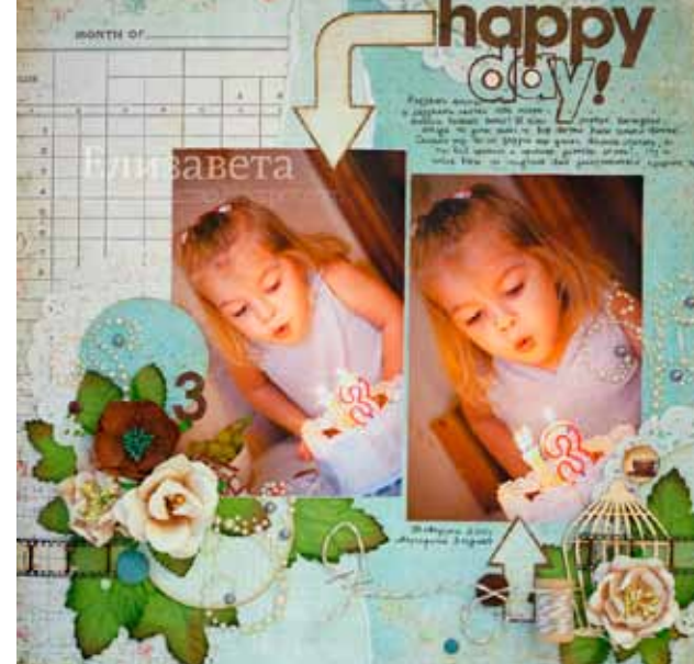
Автор – Лизавета ( http://lizzaveta-scrap.blogspot.com )

Интересная идея для создания альбома «1 сентября». В этот альбом должны помещаться фотографии детей, сделанные только 1 сентября, а рядом с фотографией сделана запись о планах ребенка на будущее (кем он хочет стать). Такой альбом, может, станет отличным подарком на выпускной вечер.