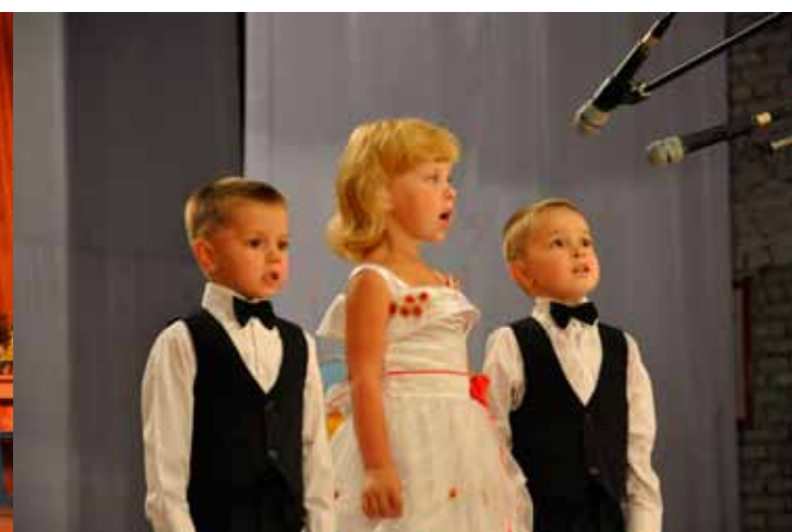
Маленькие артисты, Болотное