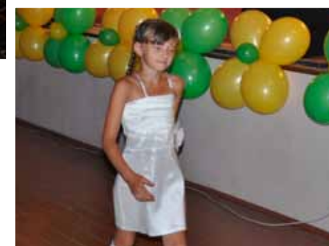
По дороге за наградой, Болотное