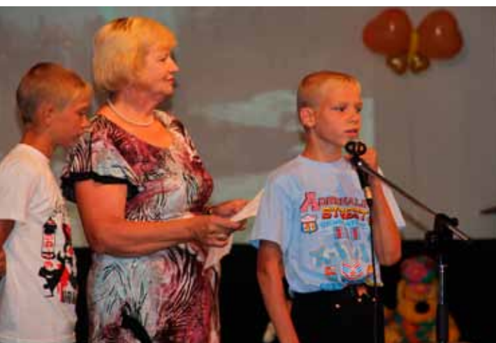
Презентация семьи, Коченево