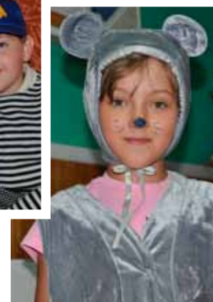
Последние приготовления перед спектаклем, Баган