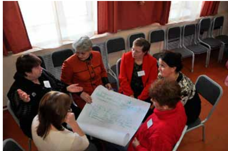
Школа приемных родителей в Татарске

В рамках Школы приемных родителей в Северном районе специалисты Центра провели практическое занятие по созданию Книги жизни приемного ребенка. Приемные родители получили советы о том, как вместе с детьми работать над Книгой, которая является хронологией событий жизни ребенка и помогает ему вспомнить и понять, что с ним произошло в прошлом. Знание прошлого поможет ребенку в социализации, осознать и разобраться в сильных переживаниях в связи с событиями в прошлом. В Книге отражаются основные вехи в его развитии, документы, информация о родителях (генеалогическое дерево, фото), особые увлечения, успехи, мечты, планы на будущее. Книга помогает сохранению идентичности приемного ребенка, имеющей важное значение для формирования привязанности и становления его как личности.