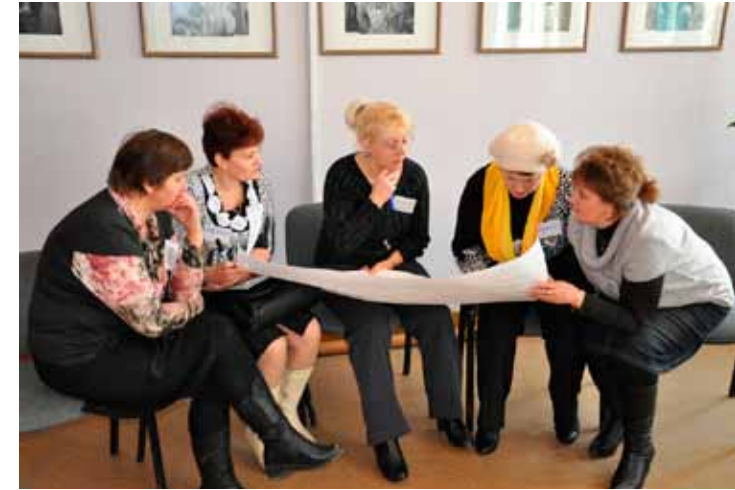
Групповое занятие школы кандидатов в приемные родители