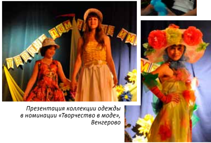
Презентация коллекции одежды в номинации «Творчество в моде», Венгерovo