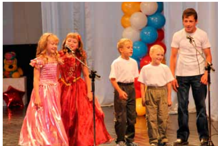
Представление семьи, Коченево