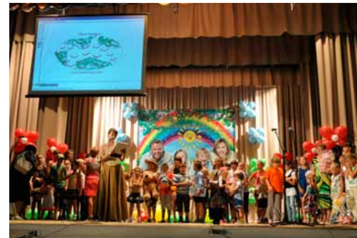
Награждение победителей и участников, Черепановo