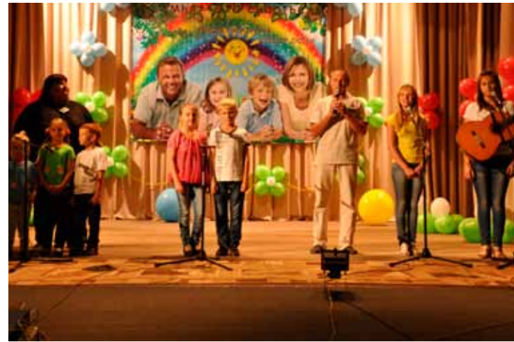
Презентация семьи, Черепановo