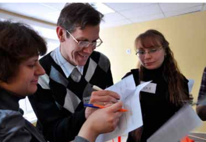
Специалисты служб сопровождения на обучении