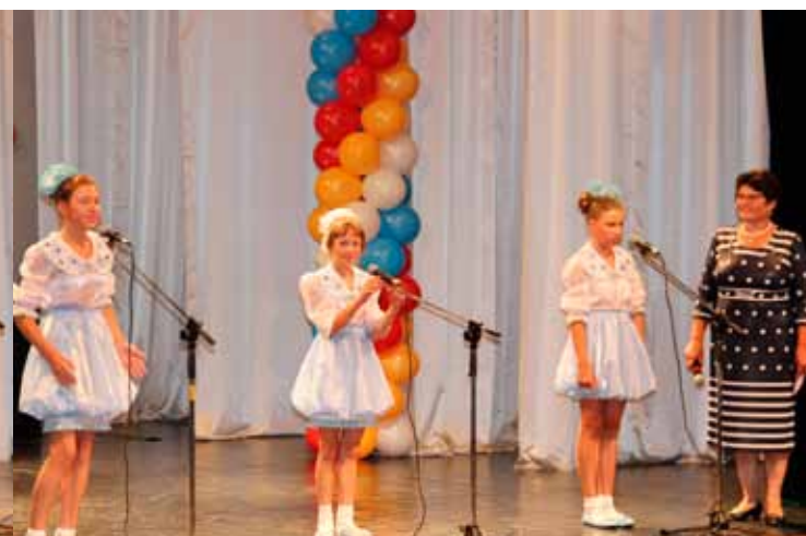
«Под присмотром» мамы, Коченево