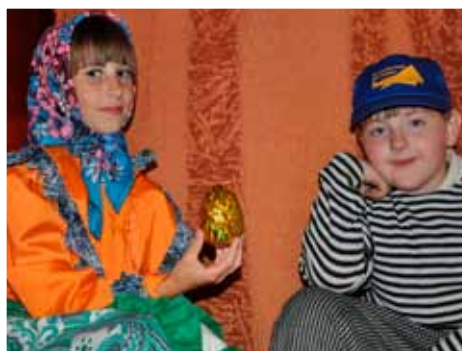
В ожидании выхода на сцену, Баган