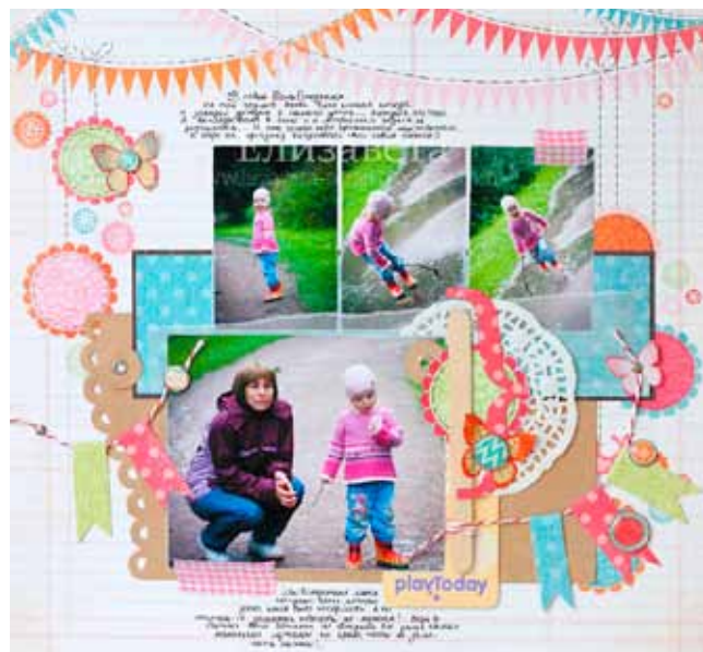
Автор – Лизавета ( http://lizzaveta-scrap.blogspot.com )

Пусть в вашей семье будет и такая традиция, как создание СЕМЕЙНЫХ АЛЬБОМОВ .