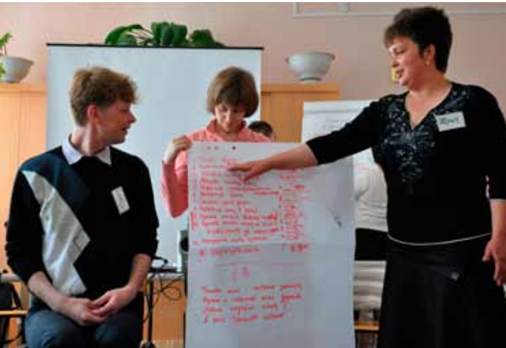
Презентация работы на школе приемных родителей в Тогучинском районе