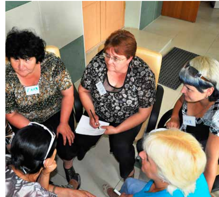
Приемные родители обмениваются опытом по созданию Книги жизни своих детей

В рамках Школы приемных родителей в Северном районе специалисты Центра провели практическое занятие по созданию Книги жизни приемного ребенка. Приемные родители получили советы о том, как вместе с детьми работать над Книгой, которая является хронологией событий жизни ребенка и помогает ему вспомнить и понять, что с ним произошло в прошлом. Знание прошлого поможет ребенку в социализации, осознать и разобраться в сильных переживаниях в связи с событиями в прошлом. В Книге отражаются основные вехи в его развитии, документы, информация о родителях (генеалогическое дерево, фото), особые увлечения, успехи, мечты, планы на будущее. Книга помогает сохранению идентичности приемного ребенка, имеющей важное значение для формирования привязанности и становления его как личности.