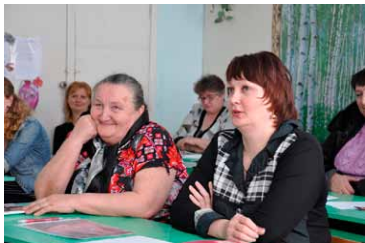
Приемные родители и опекуны слушают психолога центра на консультации