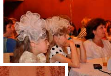
Внимательные зрители, Баган

миниатюр, творчество в моде, а также приз зрительских симпатий. Всего в отборочном цикле конкурса приняли участие более 70 семей со всей Новосибирской области, а по итогам отборочного цикла определились 30 победителей по разным номинациям, которые поедут отстаивать честь своих семей и районов уже на финальной части конкурса – трехдневном фестивале, который в этом году пройдет с 24 по 26 августа, на базе одного из детских оздоровительных лагерей в городе Новосибирске. Три дня, полные конкурсов для всей семьи, мастер-классов, игр и других интересных мероприятий, завершающиеся итоговым концертом, на котором со своими номерами выступят лучшие из лучших! А пока давайте посмотрим, как проходили отборочные этапы конкурса в районах Новосибирской области.