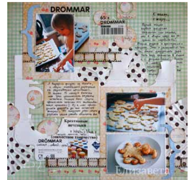
Автор - Лизавета ( http://lizzaveta-scrap.blogspot.com )

* Займитесь всей семьей каким-нибудь интересным делом во время проведения вечеров творчества. Лепка из теста или плетение из бисера, декорирование банок или шитье игрушек, чтобы вы не выбрали, помните, главное в этом творческий процесс и обучение.