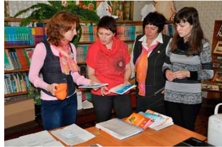
Выездной семинар и консультации психолога Центра

алистов органов опеки и попечительства и комплексных центров обслуживания населения. Занятия проходят на базе детских оздоровительных лагерей. Широко используются интерактивные методики, групповая работа, ролевые и ситуативные игры, работа со случаем.